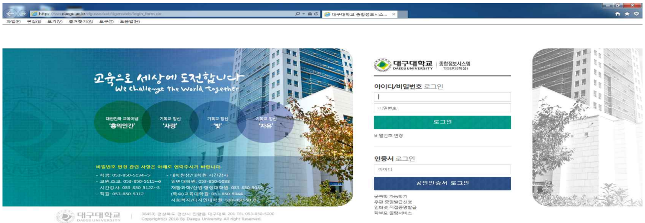
(그림 2) 패스워드 변경 클릭 → 사용자ID(학번)입력 → 현패스워드 입력(주민번호 뒷자리) → 변경